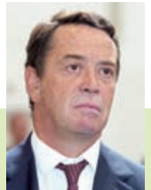
MANUEL PINHO Director

▶ PhD in Economics from the University of Paris-X. Former Portuguese Minister of the Economy, when Portugal became one of the leading world players in renewable energy and electrical mobility. In 2007, he was the president of the European Union Minister Council for Energy and of the Transatlantic Council and is the author of a New Energy Era, from which the European SET Plan is drawn.