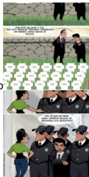
A 'Crash' média