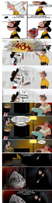
A evolução do Orçamento do Estado