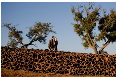
Portugal exporta essencialmente rolhas de cortiça e a ideia deste curso é incentivar a criação de outros produtos a partir desta matéria prima.

O sobreiro foi designado, em Dezembro de 2011, Árvore Nacional de Portugal, juntando-se à bandeira e ao hino como símbolo nacional. Os executivos do sector ficam agora com mais oportunidades para elevar a cortiça a outros patamares.