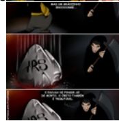
O inferno de Gaspar