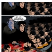
40 000 cabeças