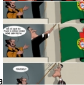
A grande bandeira