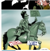
Terreiro do Passos